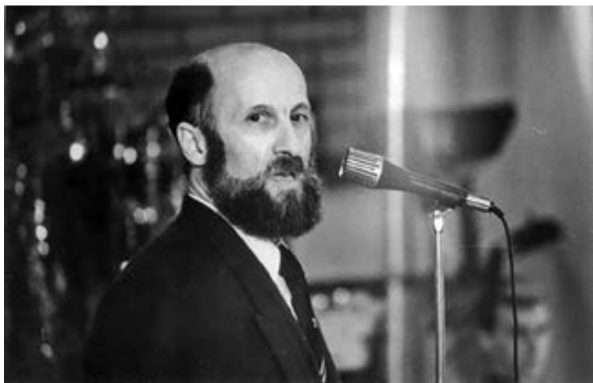
1993 год. Тюмень. Презентация Чемпионата Европы-94

– В спорте допинг существует. Этого нельзя отрицать. Результаты во всех видах растут, и, конечно, находятся люди, стремящиеся зайти за рубеж