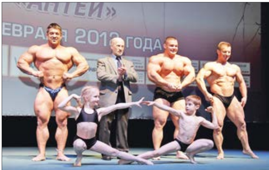
Клуб «Антей». 45-летие.

Прыгали в длину с места, подтягивались, плавали в бассейне, что вода из чаши выплёскивалась, когда стартовали мускулистые парни с весом за сто килограмм! На знаменитом в СССР турнире в Таллинне «Мемориал Георга Тэнно» 100-метровку на стадионе преодолели